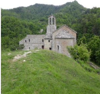
EREMO DI GAMOGNA