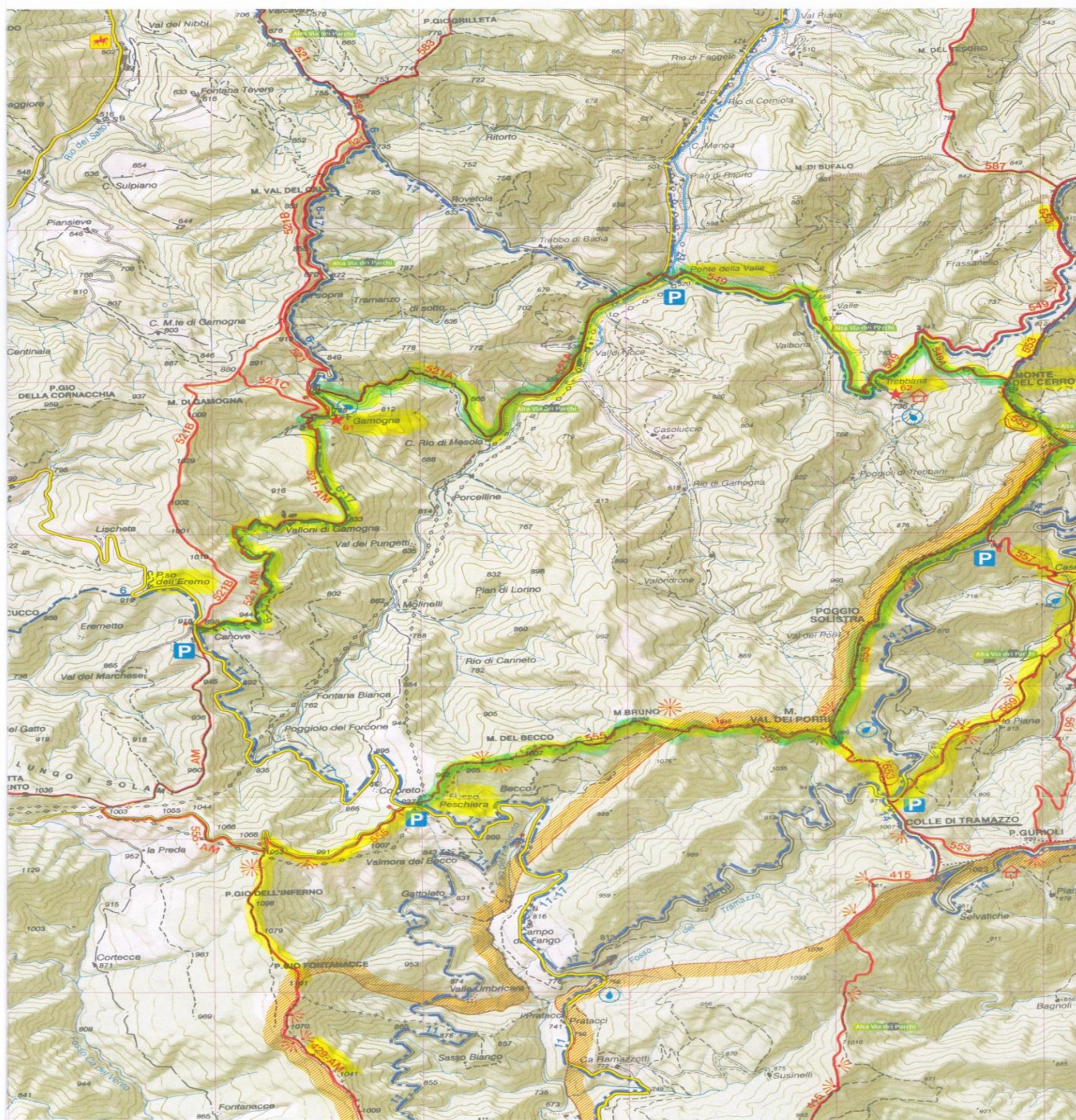
Cartina tratta da 1:25.000 Appennino Faentino Ed. S.EL.CA.